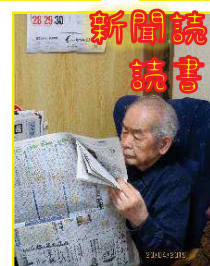
新聞読んだり 読書したり