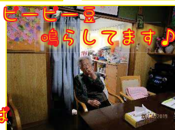
ピーピー豆 鳴らしてます♪